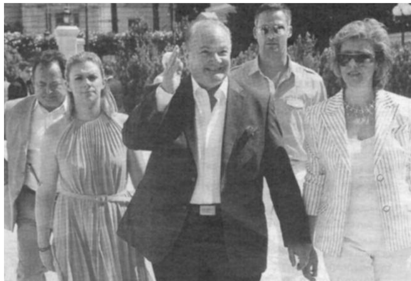
Κορίτσια! Έρχεται ο βουλευτής Γιώργος Πάντζας!